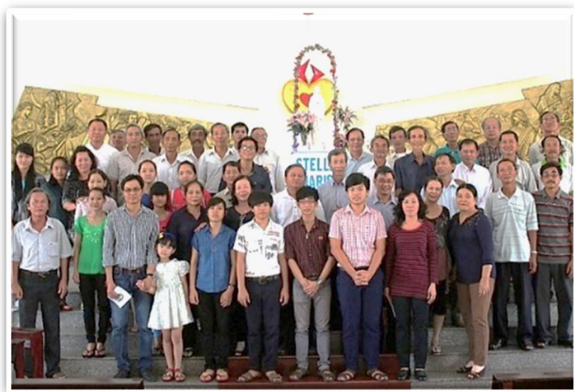
Lm. Bel San Louis, SVD