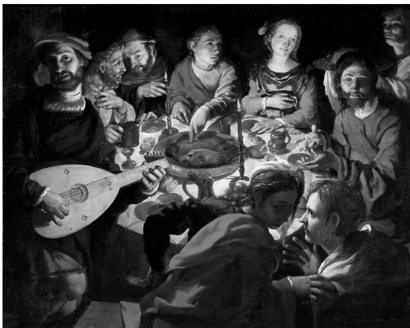
Tiệc cưới thành Cana thời Chúa Giêsu, Jan Vermeiren.

đã hóa thành rượu (mà không biết rượu từ đâu ra, còn gia nhân đã mức nước thì biết), ông mới gọi tân lang lại và nói: “ Ai cũng hết rượu ngon trước, và khi khách đã ngà ngà mới đãi rượu xoàng hơn. Còn anh, anh lại giữ rượu ngon mãi cho đến bây giờ”. Đức Giêsu đã làm dấu lạ này tại Cana miền Galilê và bày tỏ vinh quang của Người. Các môn đệ đã tin vào Người. (Ga 2: 1-11)