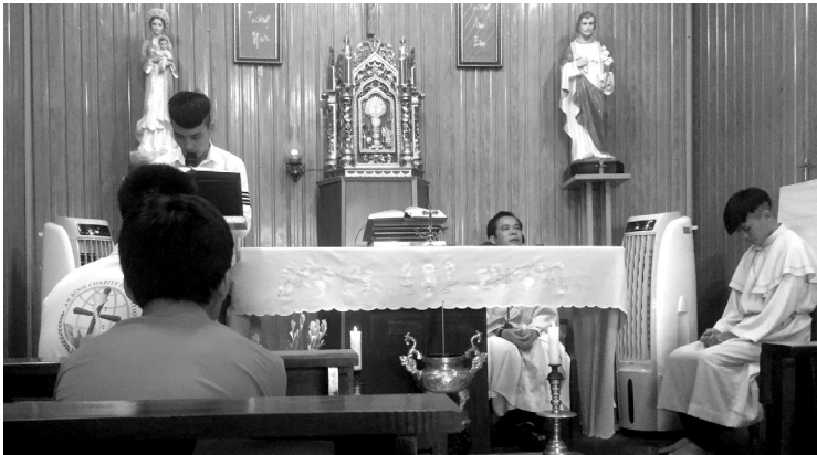
Một thánh lễ tại Trung tâm Hướng Thiện Lavang.