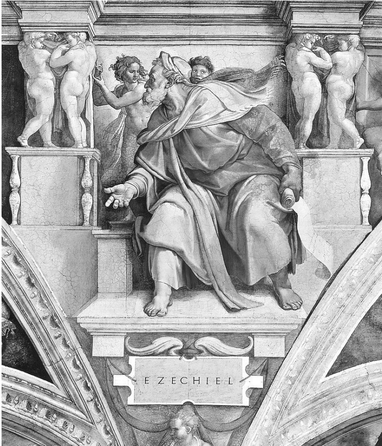
Ngôn sứ Ê-dê-ki-en qua Michel-Angelo.

Phân người, người hãy lấy lúa mì, lúa mạch, đậu tằm, đậu nâu, kê và lúa miến, rồi bỏ tất cả vào một cái vò mà làm bánh. Người nằm nghiêng một bên bao nhiêu ngày – ba trăm chín mươi ngày -, thì trong bấy nhiêu ngày người sẽ ăn bánh ấy.